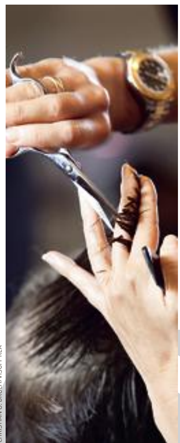
La clientèle se concentre sur les services majeurs (coupe et coloration) délaissant les « accessoires » (soins, etc.).

Plus de 70.000 établissements Or, avec plus de 70.000 établissements (60.000 salons et 10.000 entreprises de coiffure à domicile), qui reçoivent chaque jour près de 1 million de clients, la coiffure compte parmi les acteurs