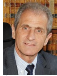
Hubert FALCO Secrétaire d'Etat chargé de l'Aménagement du territoire