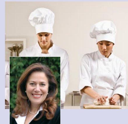
Catherine Troendle Sénateur et maire de Ranspach-le-Bas, Haut-Rhin, 620 habitants

« Le Fonds social européen est un outil essentiel pour les collectivités mobilisées en faveur de l'emploi et de l'insertion sociale.